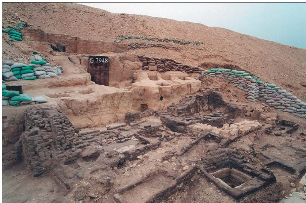
Илл. 2. Малый некрополь I перед скальной гробницей Хафраанха (G 7948), вид с юго-востока.