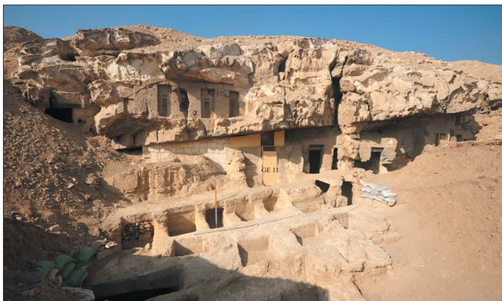
Илл. 6. Малый некрополь II перед скальной гробницей Ченти I (GE 11), вид с востока.