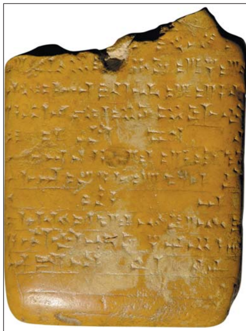
Рис. 3. Новоассирийский амулет против Ламашту с заклинанием.