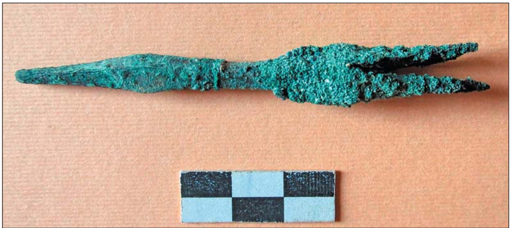
Илл. 7. Предметы из Малого некрополя II.